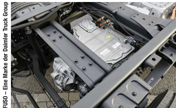
FUSO – Eine Marke der Daimler Truck Group